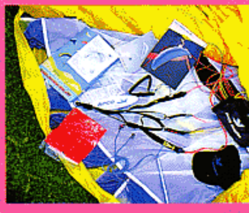
Chez Apco : beaucoup de petits cadeaux et des élévateurs très bien finis.