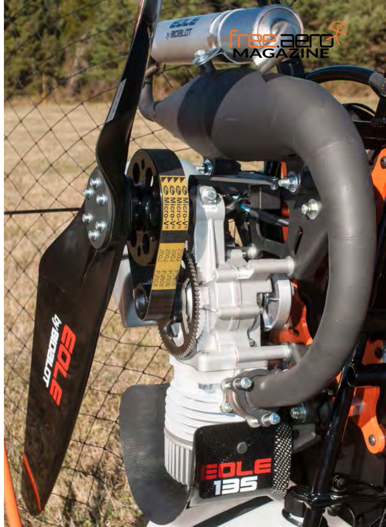
Lo scarico: ci sono voluti oltre 15 prototipi per arrivare al risultato voluto.

E' stato fatto molto sviluppo anche alla connessione tra la membrana e il sistema di scarico.