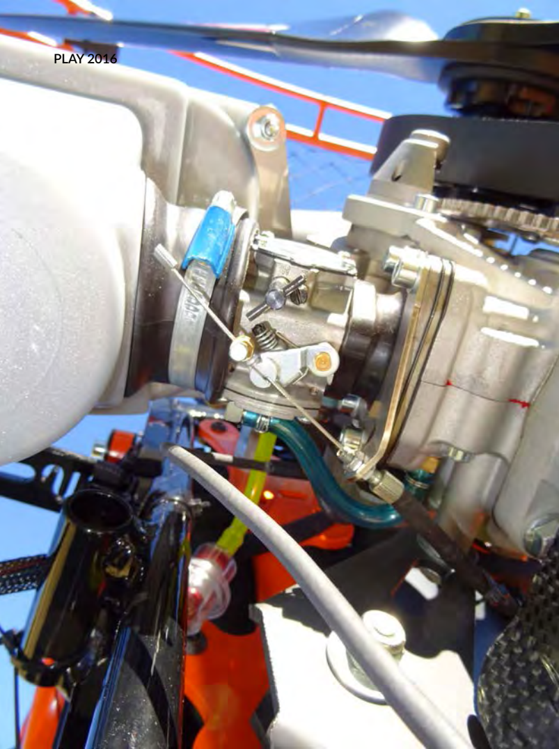
La membrana del carburatore è come sempre, difficile da regolare, ma è richiesta (è sbagliato?) da molti clienti. Ma questa è un'altra storia ...